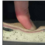
HAIX® MSL System